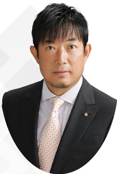
2026-27年度 国際ロータリー 第2650地区ガバナー

新しい扉は、誰かが開いてくれるものではなく、自らの意思で開くものです。この一年、会員の皆さまとともに新たな一歩を踏み出し、未来へとつながる持続可能なロータリーを築いていきたいと願っております。皆さまのご理解とご協力を心よりお願い申し上げます。