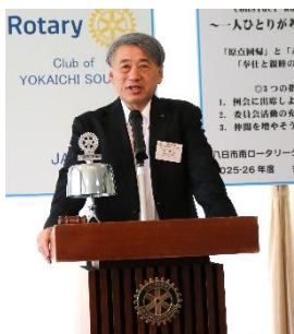
向 30 周年実行 委員長