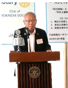
藤野ガバナー補佐