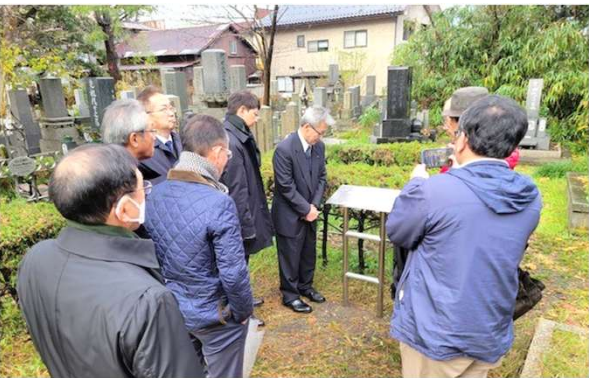
会長による慰霊碑読み上げ