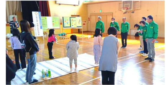
白梅学園児童からのお礼

参 加 者：白梅学園33名(児童23名、職員10名)、敦賀ロータリクラブ会員他 10名