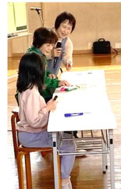
絵で伝言ゲーム(お題は「傘をさしたサル」)