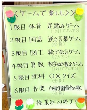
ゲームスケジュール