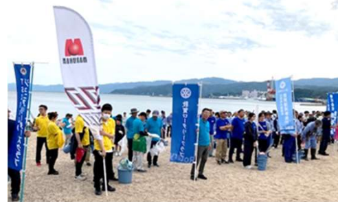
敦賀市クリーンアップ作戦参加団体