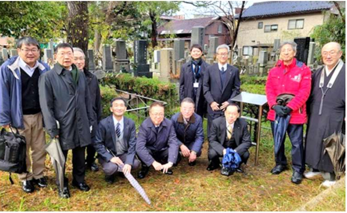
敦賀ロータリークラブ披露会参加者 (12月10日)