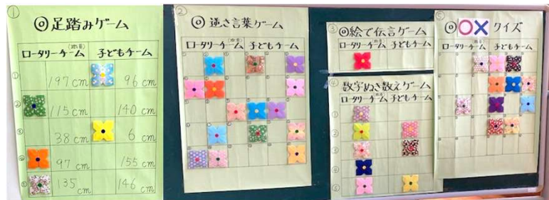
成績(3勝2敗で敦賀RCの勝利)