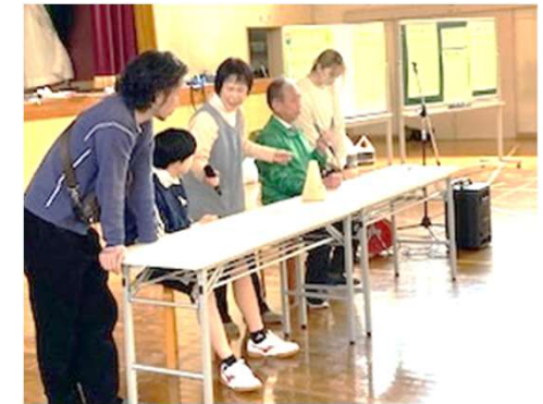
数字ぬき数えゲーム