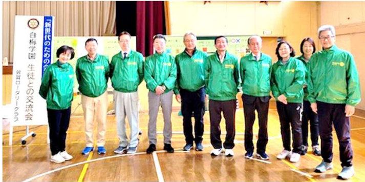
クラブからの参加者