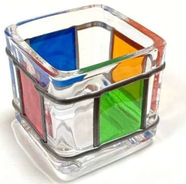
グラスアート完成品