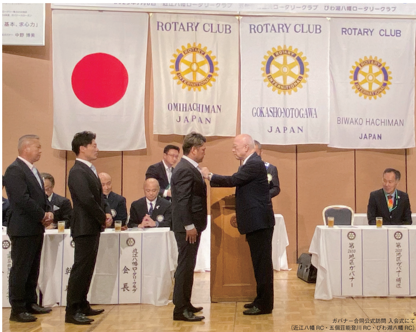
ガバナー合同公式訪問 入会式にて (近江八幡 RC・五個荘能登川 RC・びわ湖八幡 RC)