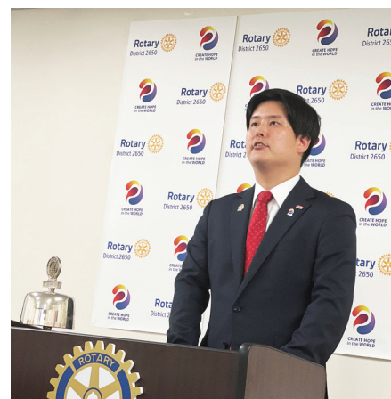
宮下地区ローターアクト代表