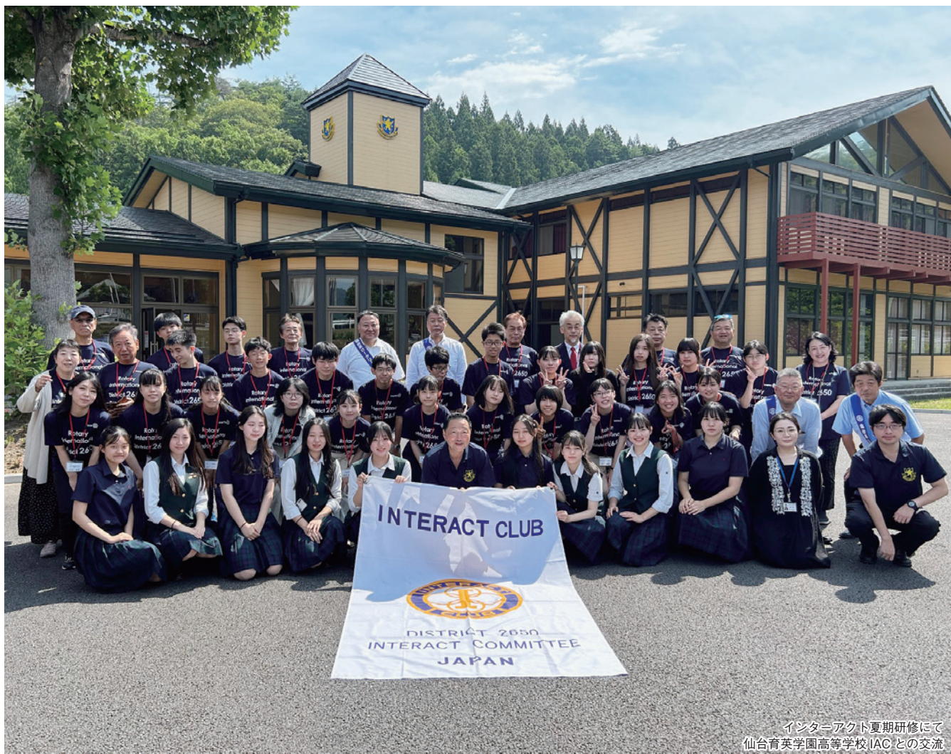
インターアクト夏期研修にて 仙台育英学園高等学校 IAC との交流