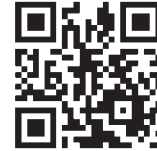
(小浜放生祭 最新情報)