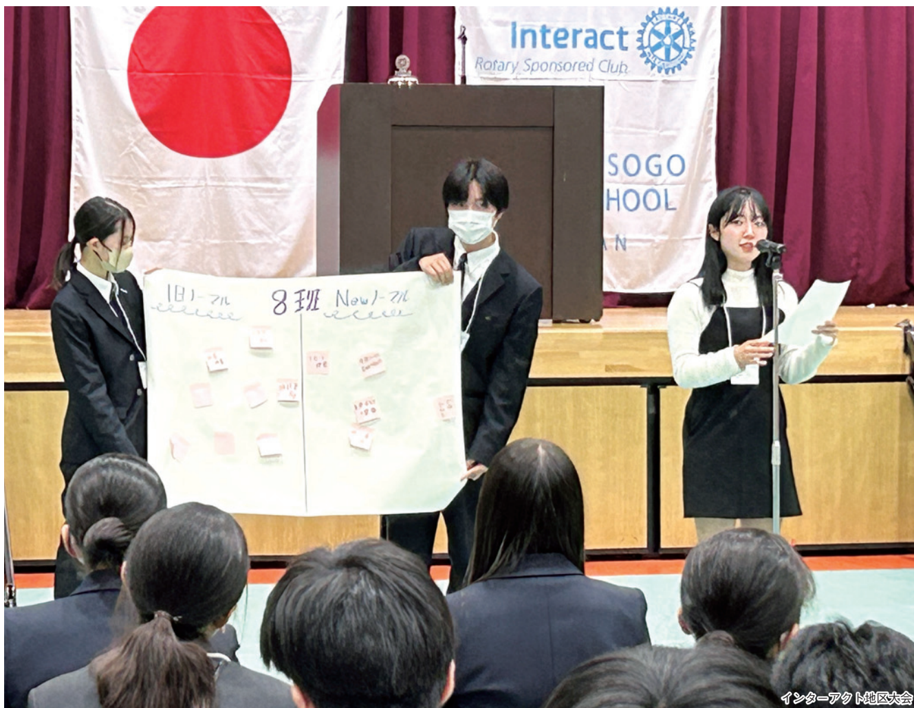
インタラクティブ地区大会