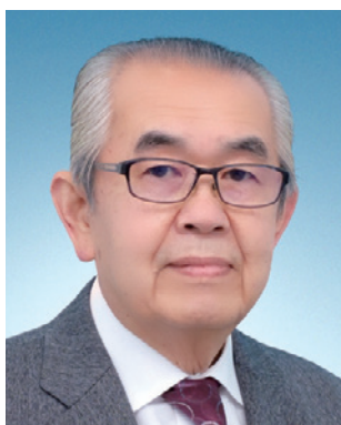
京都市域第3グループ ガバナー補佐