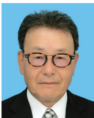
京都市南第1グループ ガバナー補佐

「ロータリーとは何ですか？」と聞かれたら、この3つのエッセンスをストーリー化して、明確に、わかりやすく説明できることが大切です。たとえば「世界中のロータリークラブには、地域社会の重要な問題に取り組もうとする有志が集まり、行動を起こしています。」 また「ロータリーを通じて、社会貢献に関心のある人たちと知り合い、一緒に活動し、世界中に友人や恩師となる人ができました。」と言うように、自分なりの説明を用意してみましょう。会員増強に有効でお勧めいたします。