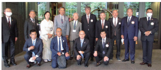
京都洛西・京都嵯峨野