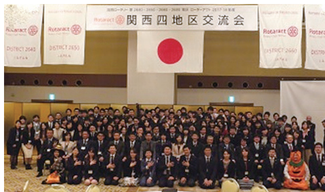
図-2 関西四地区交流会の様子(2017年10月29日撮影)