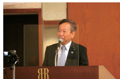
田村地区IA委員長の挨拶と主旨説明