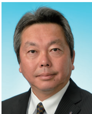
京都北部グループ ガバナー補佐