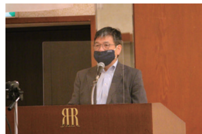
才門地区IA副委員長による全般の注意事項