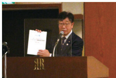
小島地区IA委員による研修行程の説明