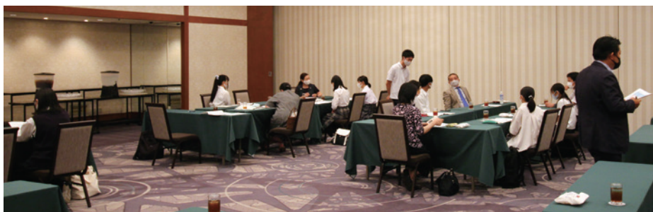
班ごとに分かれてのグループディスカッションの様子