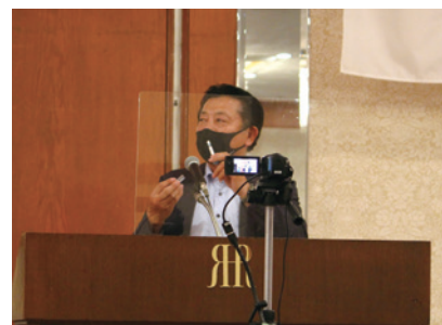
寺田地区IA副委員長による抗原検査の説明