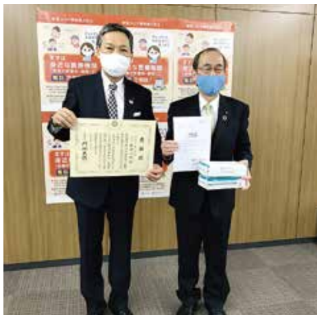
馬場ガバナーエレクトから門川市長へお手渡し