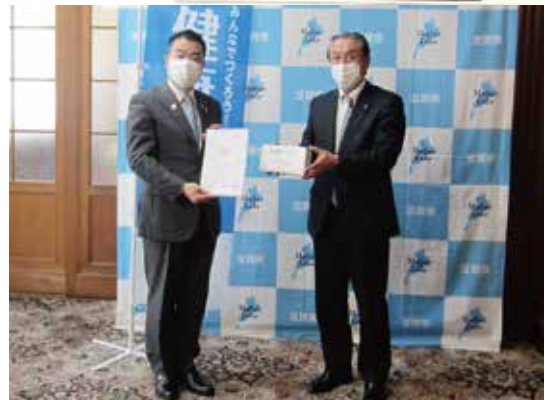
尾賀ガバナーノミニーから三日月知事へお手渡し