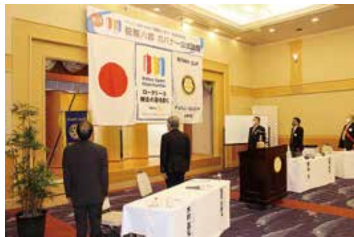
コロナ禍でのガバナー公式訪問(福井水仙RC・単独)