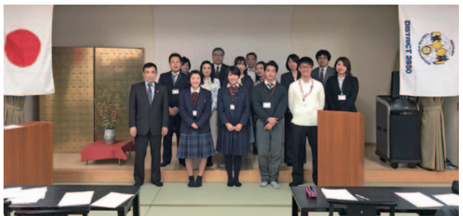
一泊二日の研修会で親睦も深まり、学生・保護者・地区委員と一つのチームができました