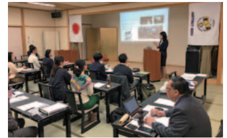
ROTEX からの体験談スピーチ。 派遣予定学生は先輩の話に聞き入っています