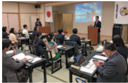
岩滝委員長 開会の挨拶