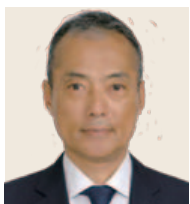
2018-19年度 財団奨学金委員会 委員長