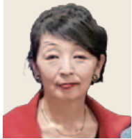
2018-19年度 グローバル補助金委員会 委員長