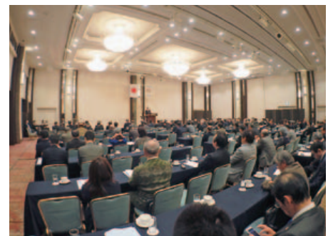
第1部 委員会別会議