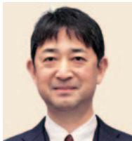
2018-19年度 地区補助金委員会 委員長