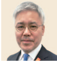
2018-19年度 フェロシップ委員会 委員長