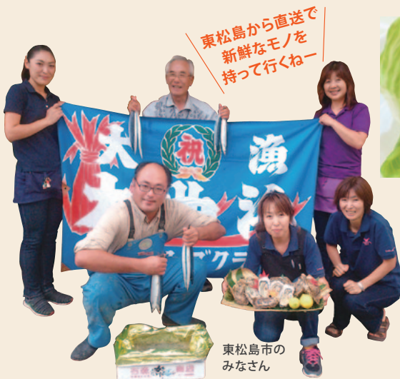
東松島のみなさん

この地区大会「大懇親会」におきましても、「絆」をテーマに人と人の絆をつなぐ交流を生みだし、第2650地区の絆を一層深める大懇親会を開催します。