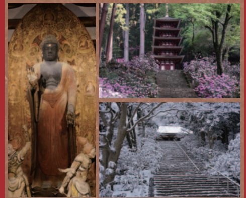
むろうじ 女人高野 室生寺

四寺院は四季折々に境内を彩る花々や見どころもたくさんあり、悠久の歴史が今に息づく場所です。