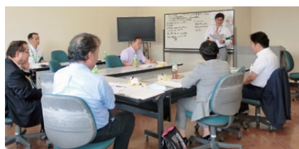
セッション(リーダーシップの本質をつかむ)

ました。RLIは、当地区では本年度で9年目(8回目)の開催となり、既に受講修了生は661人に達し、修了者は458人(うちDL就任者は126人)となっています。去る3月のPETS(会長エレクト研修セミナー)でも、RLIで実施される討議形式を採用しました。