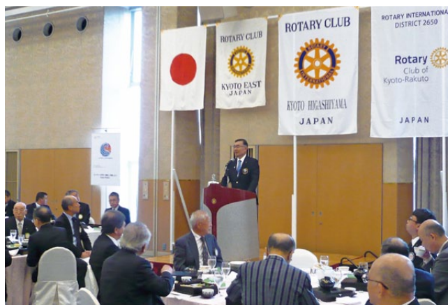
京都東RC・京都東山RC・京都洛東RC 合同例会風景