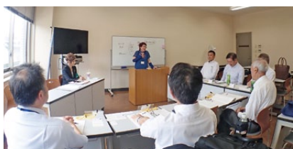
セッション(全員を引き込む)

RLIはロータリアンにボランティア組織にとって重要なリーダーシップ技能と質の高い教育を提供することを目的の一つに掲げています。