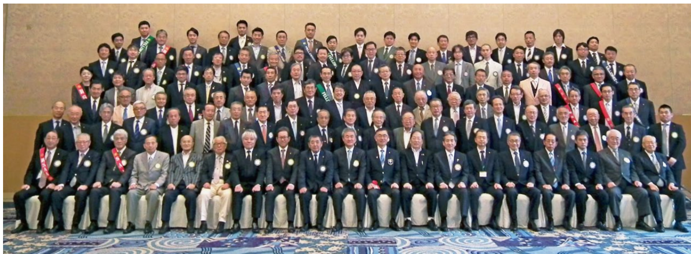
京都東RC・京都東山RC・京都洛東RC 合同例会 集合写真