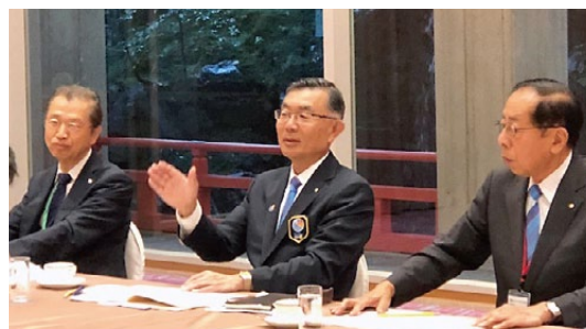
京都東RC会長・幹事との懇談会