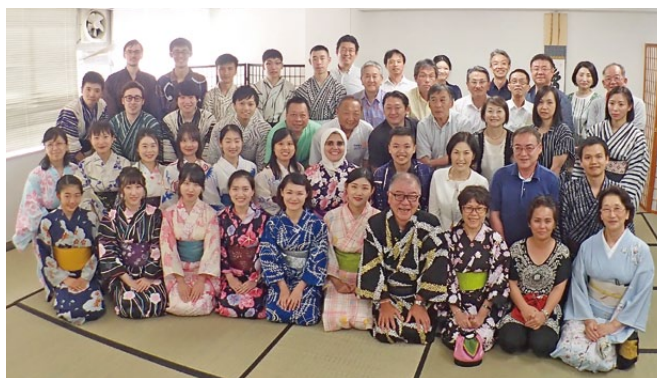
米山奨学生の皆さんとカウンセラーの方々

当日は本年最高の暑さで、京都は38度を記録しましたが、米山奨学生達は、日本三大祭りの祇園祭と日本の夏を身をもって体験しました。