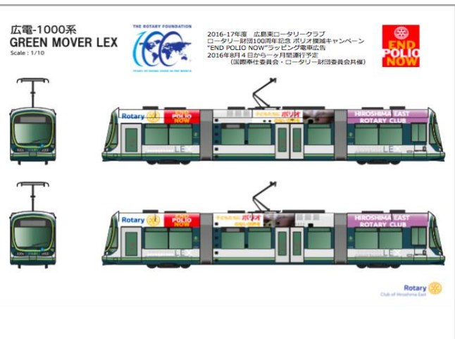
このイラストは広島市内の路面電車に搭載された「END POLIO NOW」の動く広告です。