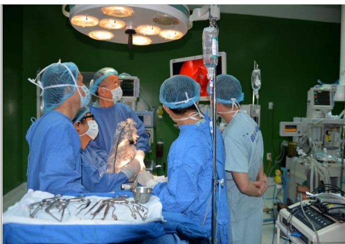
ベトナムのダナンの市民病院へ派遣しているVTT医療チーム派遣プロジェクトです。