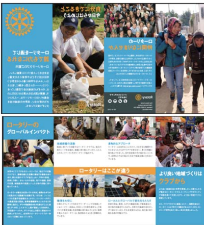
会員候補者向け資料:自分のできることを今日から始めよう (資料番号:001)

ロータリーとは何かを説明するには写真にある3つのフレーズを使うと一貫性があり、明確に表現できます。様々な「リーダーが集まり」「アイデアを広げ」社会のために「行動する」