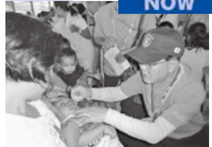
ポリオ撲滅に挑む