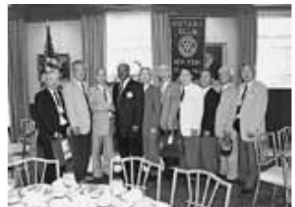
海外クラブとの交流 （ニューヨークロータリーでの例会参加）