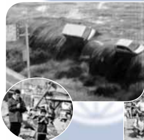
東日本大震災復興への支援活動