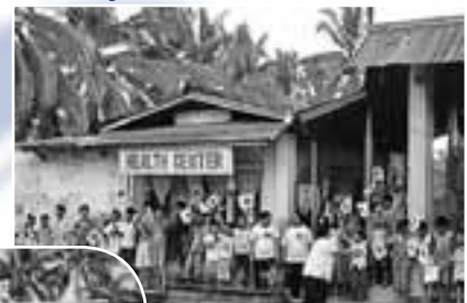
地域の保健所に井戸水が出るように、ポンプや設備を寄贈。 (フィリピン・レイテ島)