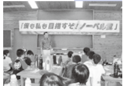
青少年のためのさまざまな支援