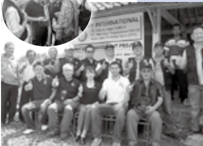
VTT事業(インドネシアでの水資源の確保と管理)