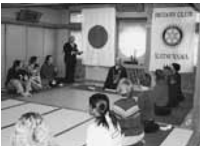
青少年交換（研修生の座禅体験）