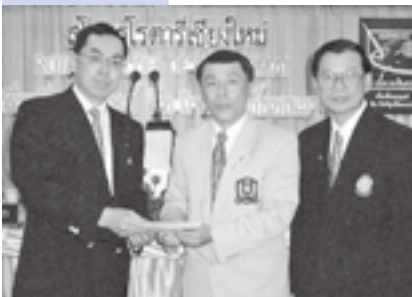
友好クラブ締結 (タイ・チェンマイRC)