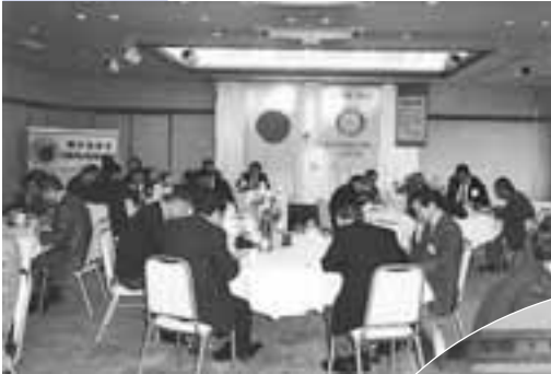
年度始めの計画を 検討する協議会 地区研修・協議会

週1回、決められた会場で、 会員が揃って奉仕活動や 卓話、親睦を深めるための 例会が開かれる。