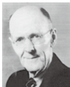
ロータリーの創始者 ポール・ハリス氏 (1868～1947)