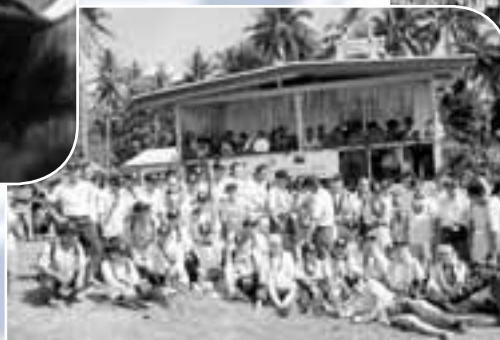
パプアニューギニアでの活動。 毎年、WHOと協力しポリオワクチンの接種活動。