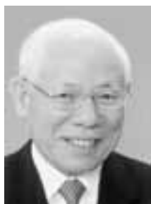
日本で3人目の国際 ロータリー会長（2012- 13）の田中作次氏 （埼玉・八潮RC）

その後の日本におけるロータリーの拡大発展は目覚ましいものがあります。ロータリー財団への貢献も抜群で、今や国際ロータリーにおける日本の地位は不動のものになりました。現在、日本国内のクラブ数は約2,270、会員数は約88,500人以上になっています。