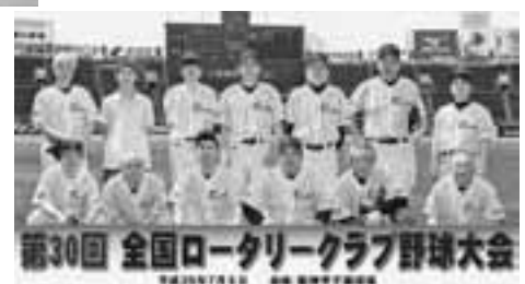
同好会などの親睦活動