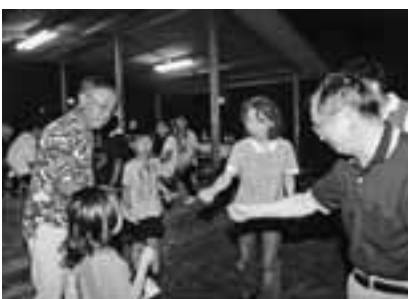
家族をまじえて、家族例会