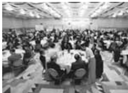
会員による相互交流会と親睦会