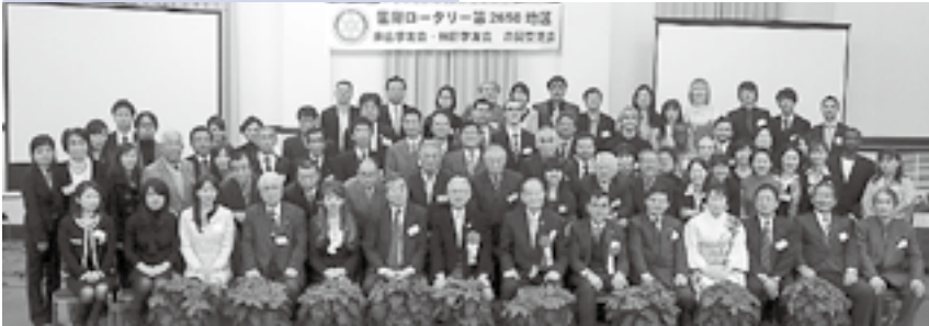
米山学友会・財団学友会 合同交流会