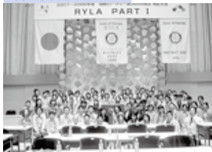
若者と思ひ切り話そう