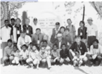
水資源確保の海外支援