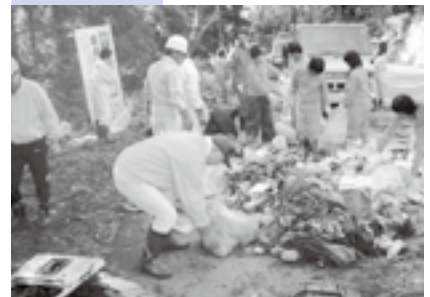
不法投棄物撤去作業など、環境を守る