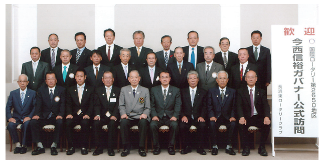
長浜東ロータリークラブ ガバナー公式訪問