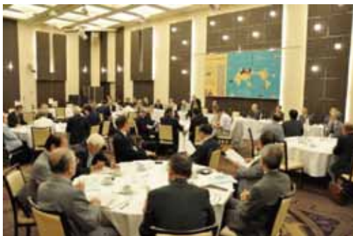
評議員会のようす