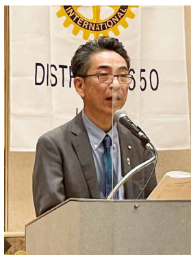
長谷川地区会計長