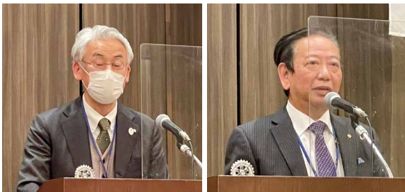
宇野次年度委員長