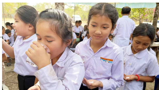
奈良東RC 住血吸虫症服薬お手伝い