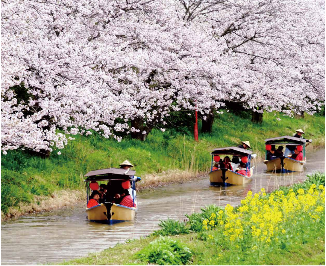
水郷めぐり 4月初旬