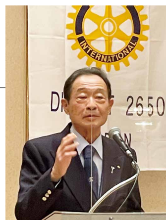
河本地区研修リーダー