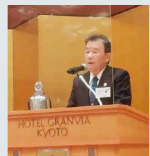
裏出豊ガバナー補佐