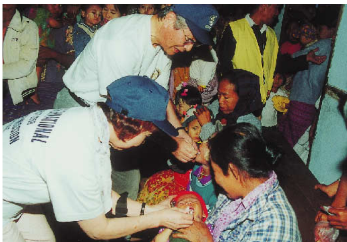
ミャンマー・マンダレーでのポリオワクチン投与(2002.1.9~17)

残念ながら、ポリオはまだ世界からは消えてはいません。2002年2月までの1年間で、まだ世界で10ヶ国、471人の子どもがポリオに罹患しています。ワクチンが届かなかったからです。障碍となっているのは、地域戦争、政治的レベル、そして資金不足です。そこで、資金不足の解消のため、RIは2002年7月から翌年2003年6月までに、ロータリーとして世界で8,000万ドル募金が必要だと呼びかけているのです。今回、RI 2650地区はRIの要請を受けて、全ての地区クラブ、全ての地区ロータリアンにポリオ撲滅のための募金活動を要請します。募金は単にお金が集まるということだけでなく、ロータリアンや地域住民の意識を喚起し、奉仕活動の輪が広がるのが大切です。そのため、以下のようなお願いをします。